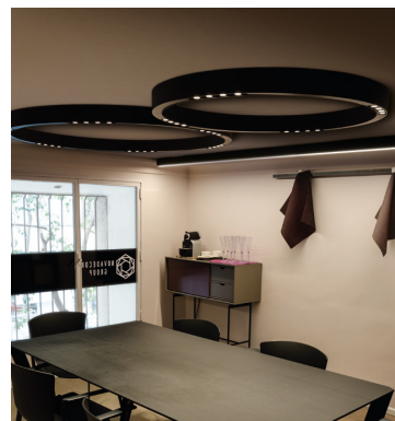
Plafonnier LED en aluminium.