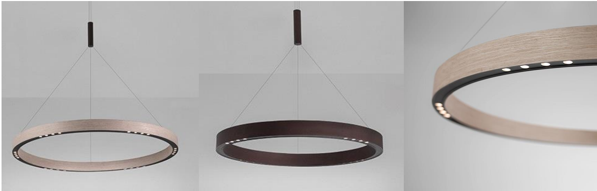
Suspension LED en aluminium.